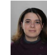
Isabel Assureira Classe de Mme Audoux – CE2/CM1